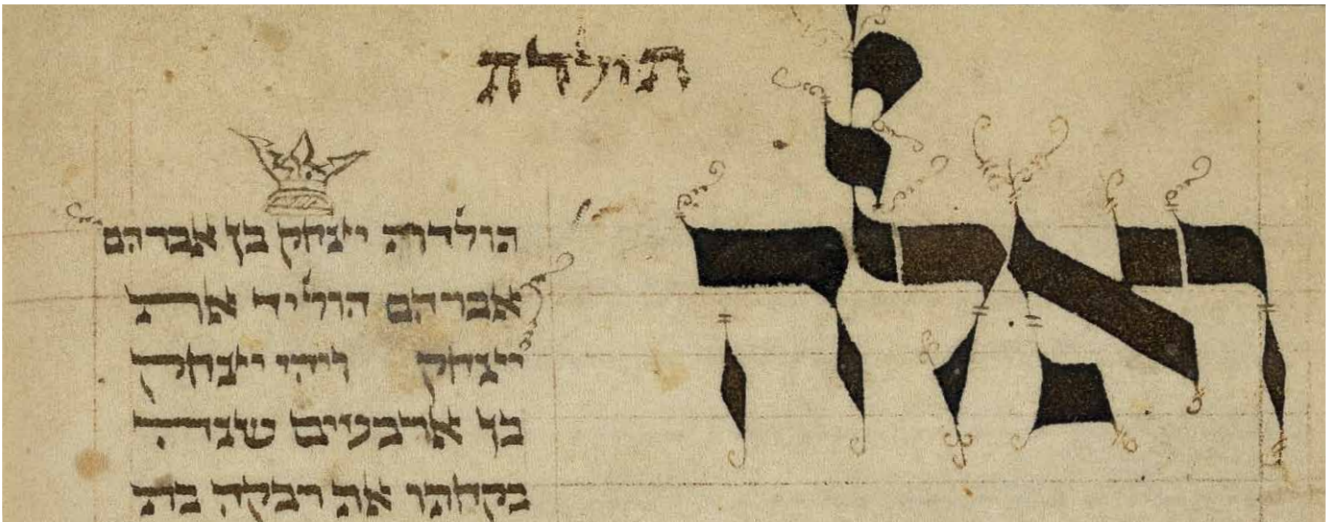
Fig. 2: Cod. Levy 17, fol. 20 v (Detail). Der Schreiber markiert seinen Namen mit einem Krönchen. | The scribe marks a crown over his name.

dient ein solches Manuskript als Vorlage. Der Codex ist illuminiert: der Beginn der einzelnen Wochenabschnitte wird durch verzierte und gerahmte Initialwörter hervorgehoben. Der Schreiber gibt seinen Namen durch ein Krönchen zu erkennen, das den Namen Isaak, Sohn des Abraham / Yiṣḥaq ben Avraham im Vers Genesis 25,19 (fol. 20 v ) schmückt.